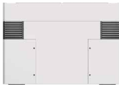
DUPLEX 770 Inter-H